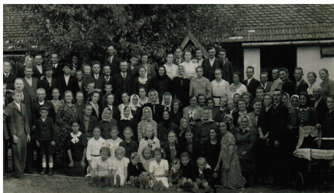
Na dvoře po sborové slavnosti v Uljaniku v roce 1939