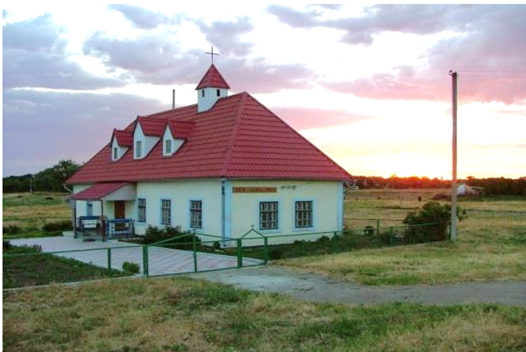
Veselynivka - modlitebna