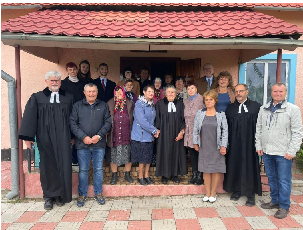
Před modlitebnou ve Veselynivce (viz článek na str. 29-31)

Informační věstník zapsaného spolku EXULANT. Vydává EXULANT, zapsaný spolek. Vychází 2x ročně. Sídlo spolku i redakce: Jungmannova 22/9 (Husův dům), 110 00 Praha 1 – Nové Město, Česká republika. http://exulant.evangelnet.cz , registrace MK ev.č. E23692 ISSN 1801-514X