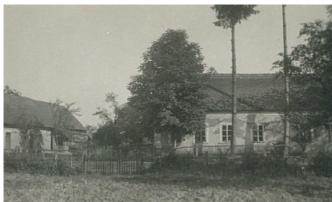
První modlitebna v Horním Uljaniku (v Prasicích)