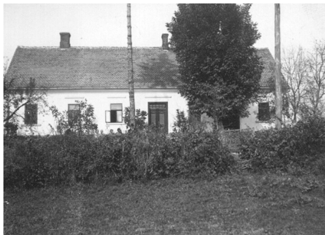
Fara a modlitebna v Uljaniku