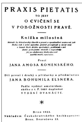
Obr. 4. Komenský, J. A. Praxis Pietatis . Brno 1922. XIX. 433 s.