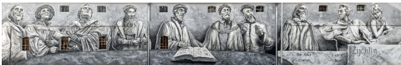
Zed' reformace v městě Żychlin (Polsko)

Podmínkou členství v našem spolku není osobní „příslušnost“ k exilu, resp. k reemigraci. Do svých řad zveme všechny zájemce o dědictví české reformace, starší i mladé. Přihlásit se můžete písemně na adresu spolku nebo emailem na exulant@evangnet.cz . Z každé přihlášky máme radost. Po obdržení přihlášky Vás zařadíme do adresáře pro zasílání věstníku.