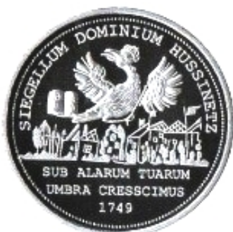
1. strana: Orlice (s tělem husy) nad táborem, drží Bibli a žezlo.