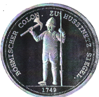
2. strana: Husita ve zbroji Böhmischer colon . Zu Hussinetz Siegel = Pečeť české kolonie Husinec 1749

Nápisy: Siegellum Dominium Hussinetz = Pečeť obce Husinec; Sub alarum tuarum umbra cresscimus 1749 = Pod křídly rosteme od 1749.